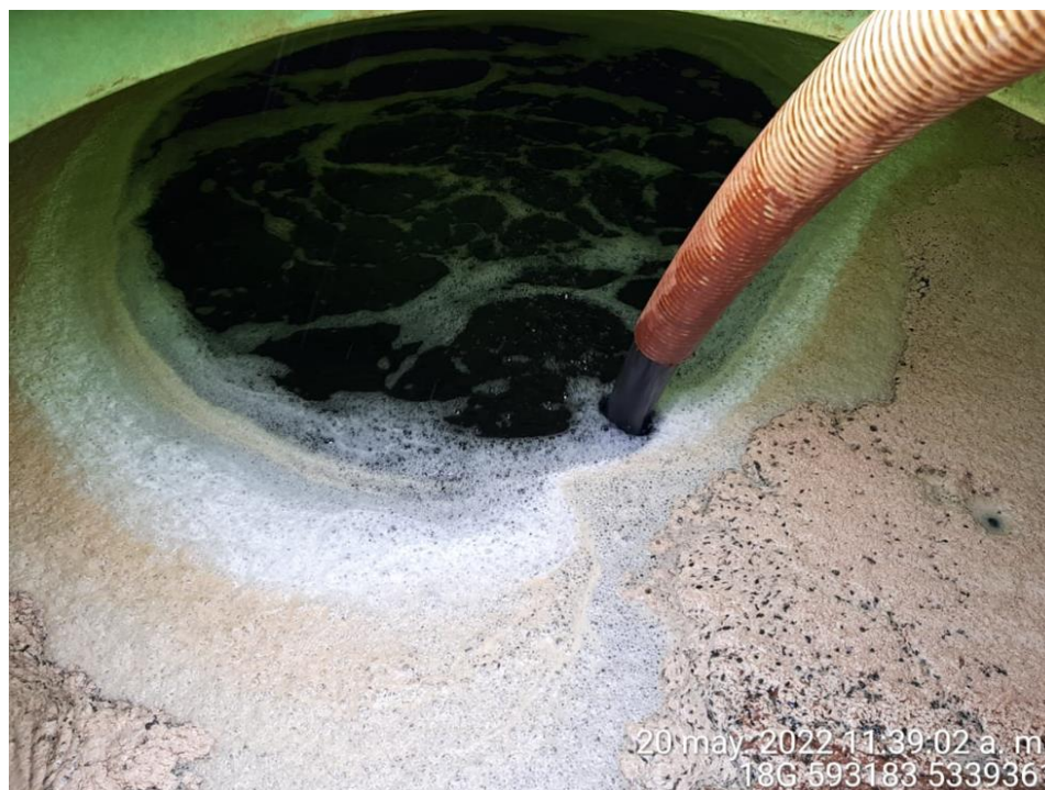
Fotografía N°19: Extracción de Lixiviados a estanque. Tomada: Viernes 20 de Mayo del 2022.

Respecto a los retiros de lixiviados se mencionan en la siguiente tabla el cronograma y Cantidad de lixiviados retirados por jornada correspondiente del 16 al 22 de Mayo del 2022.