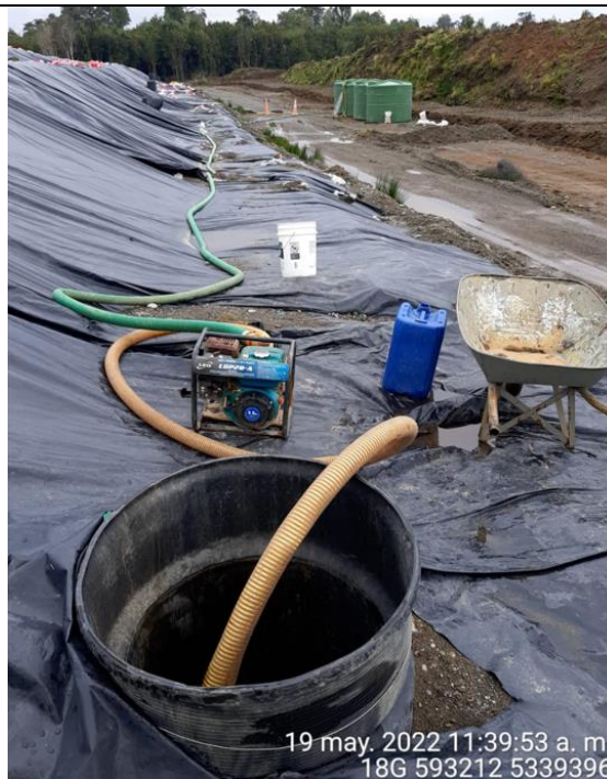
Fotografía N°16: Extracción de Lixiviados Cámara C14. Tomada: Jueves 19 de Mayo del 2022.