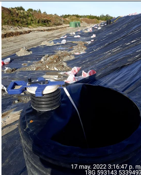
Fotografía N°22: Medición de Niveles de cámaras por Personal Municipal. Tomada: 17 de Mayo del 2022.