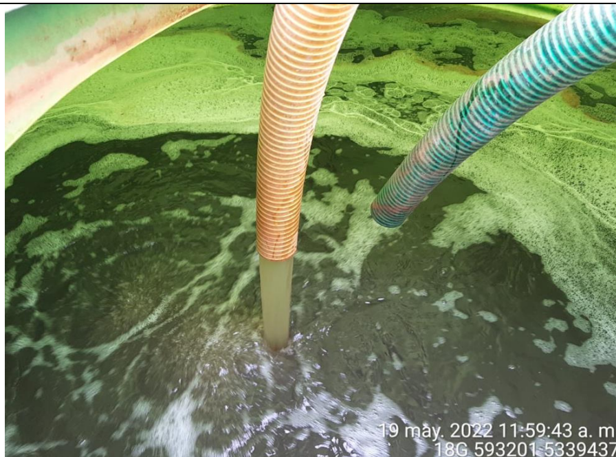
Fotografía N°17: Extracción de Lixiviados a estanque por personal municipal. Tomada: Jueves 19 de Mayo del 2022.