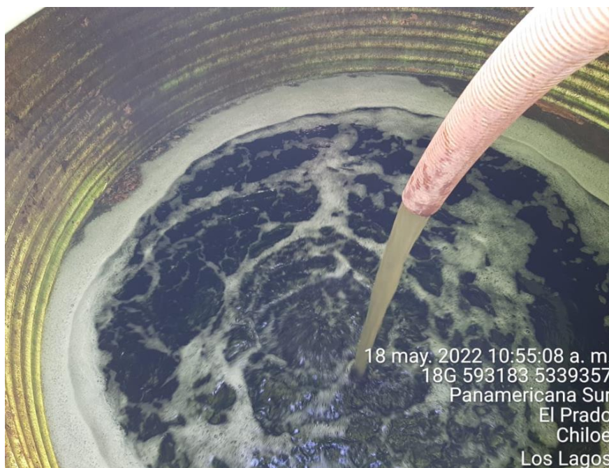
Fotografía N°13: Extracción de Lixiviados a estanque por personal municipal. Tomada: Miércoles 18 de Mayo del 2022.