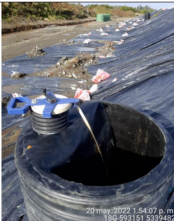
Fotografía N°25: Medición de Niveles de cámaras por Personal Municipal. Tomada: 20 de Mayo del 2022.