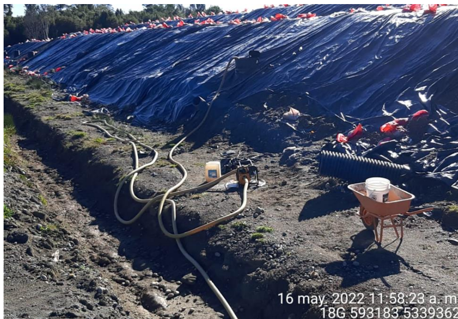
Fotografía N°3: Extracción de Lixiviados desde Cámara C03. Tomada: Lunes 16 de Mayo del 2022.