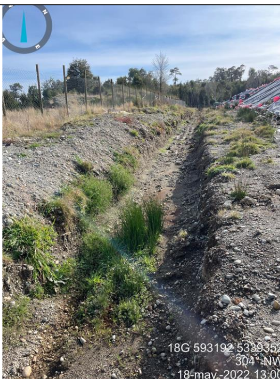
Fotografía N°28: Estado canales aguas lluvias