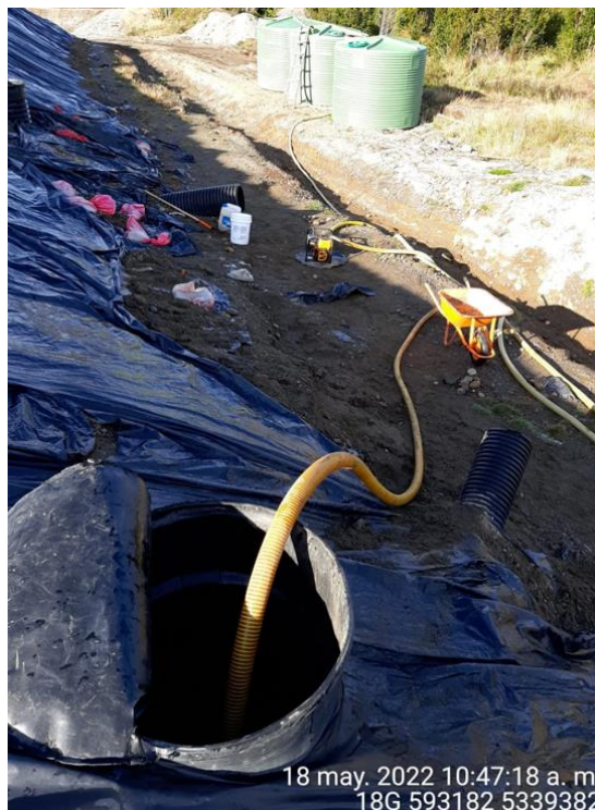
Fotografía N°12: Extracción de Lixiviados C03 por personal municipal. Tomada: Miércoles 18 de Mayo del 2022.