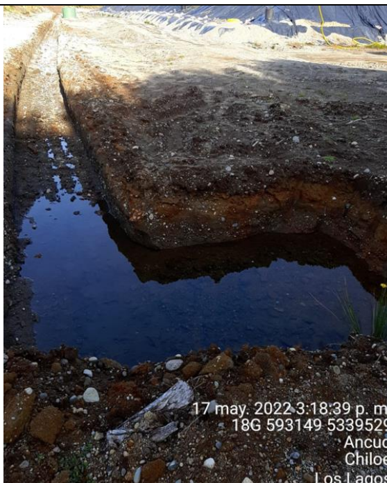
Fotografía N°27: Estado canales aguas lluvias