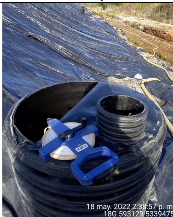
Fotografía N°23: Medición de Niveles de cámaras por Personal Municipal. Tomada: 18 de Mayo del 2022.