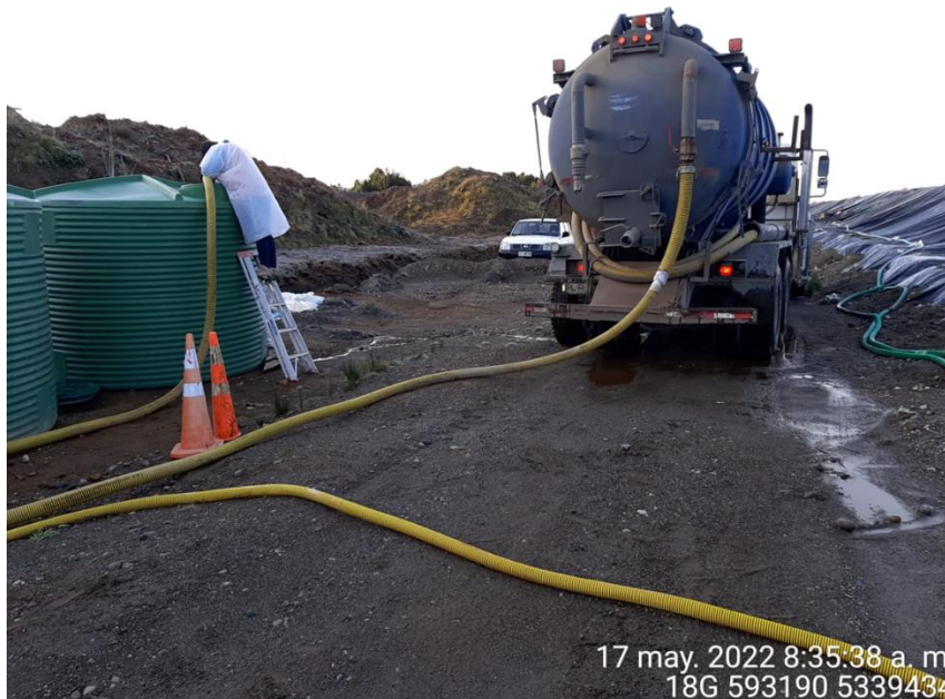
Fotografía N°10: Retiro de Lixiviados por Empresa Tresol. Tomada: Martes 17 de Mayo del 2022.