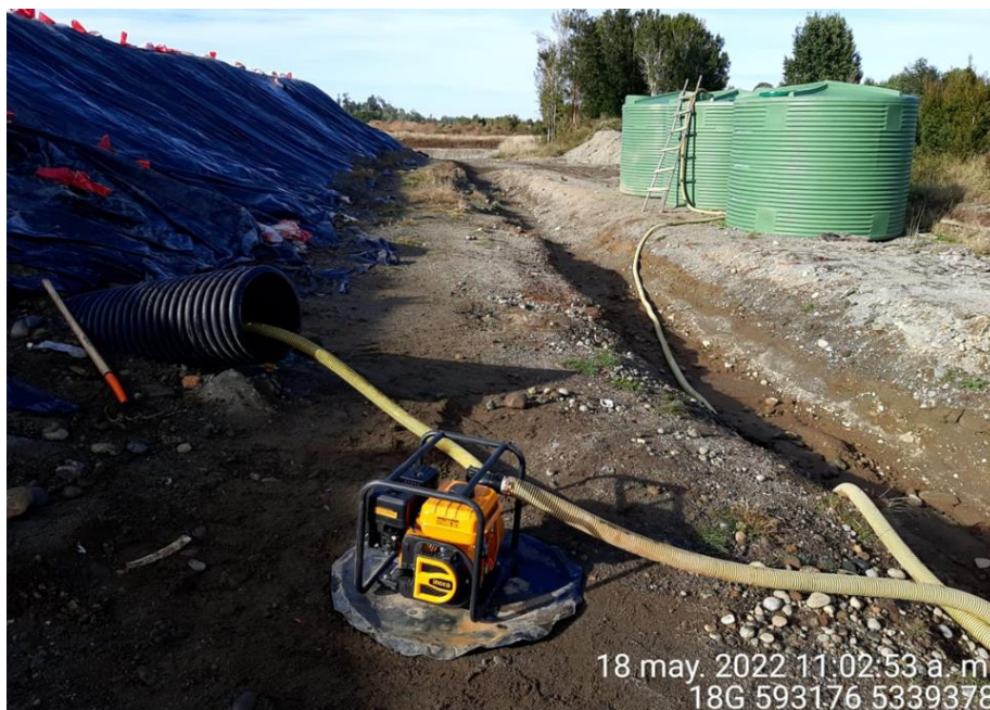
Fotografía N°11: Extracción de Lixiviados desde diagonal D02 por personal municipal. Tomada: Miércoles 18 de Mayo del 2022.