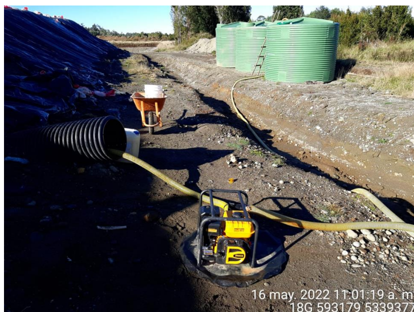
Fotografía N°2: Extracción de Lixiviados desde diagonal D02. Tomada: Lunes 16 de Mayo del 2022.