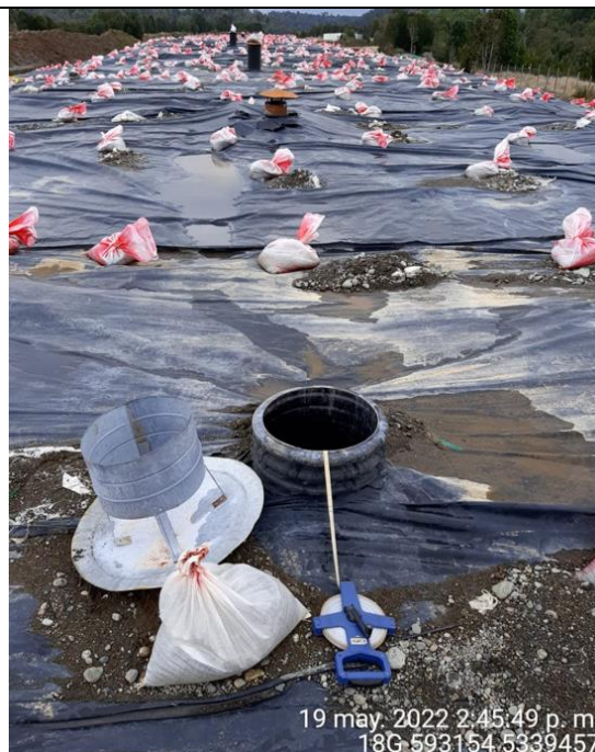
Fotografía N°24: Medición de Niveles de cámaras por Personal Municipal. Tomada: 19 de Mayo del 2022.