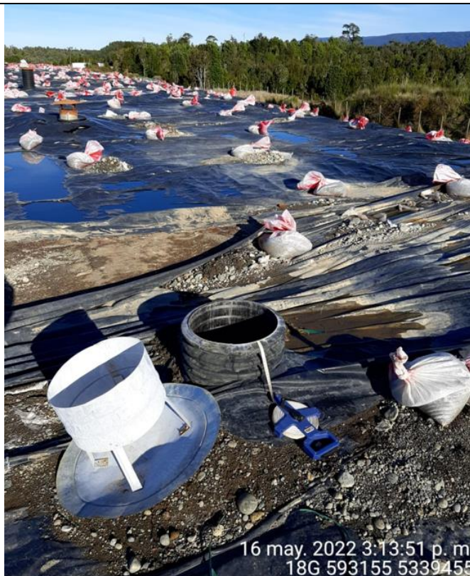
Fotografía N°21: Medición de Niveles de cámaras por Personal Municipal. Tomada: 16 de Mayo del 2022.