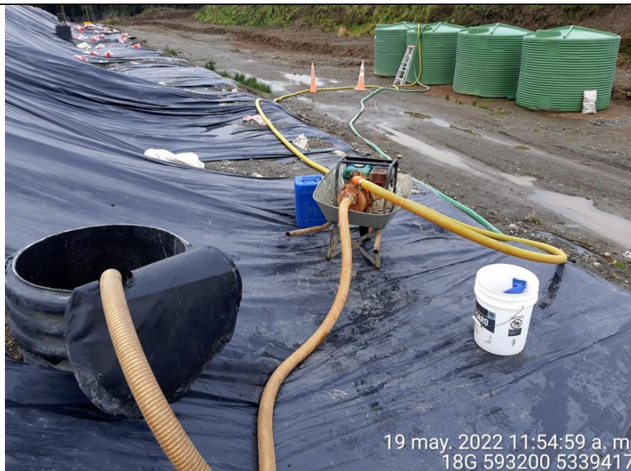
Fotografía N°15: Extracción de Lixiviados Cámara C13. Tomada: Jueves 19 de Mayo del 2022.