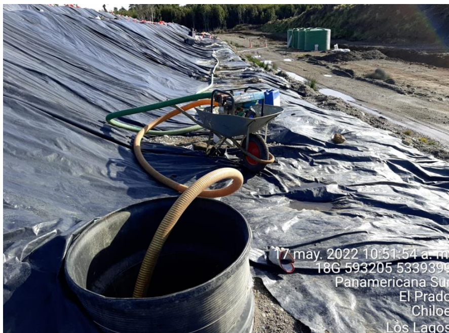
Fotografía N°7: Extracción de Lixiviados desde C14 por personal municipal. Tomada: Martes 17 de Mayo del 2022.