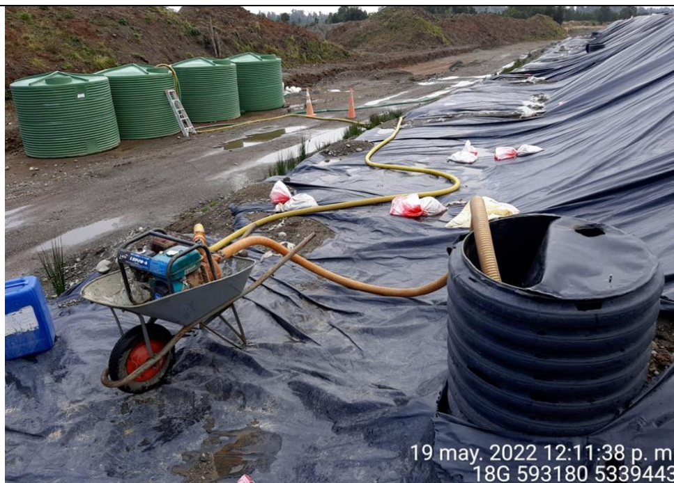
Fotografía N°14: Extracción de Lixiviados Cámara C12. Tomada: Jueves 19 de Mayo del 2022.