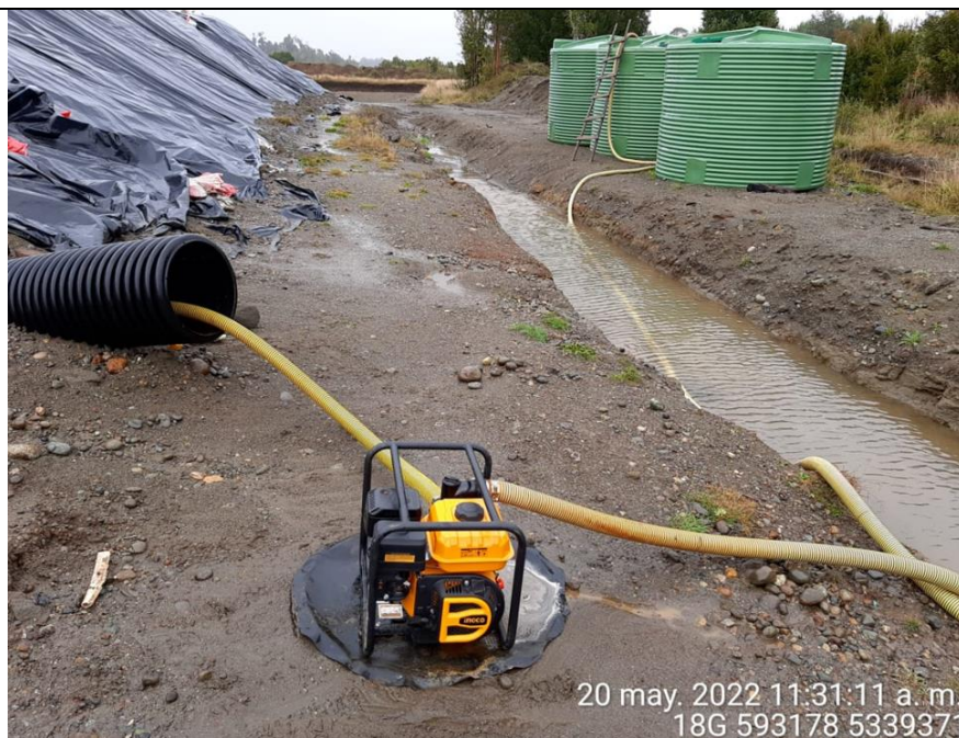
Fotografía N°18: Extracción de Lixiviados desde diagonal D02. Tomada: Viernes 20 de Mayo del 2022.