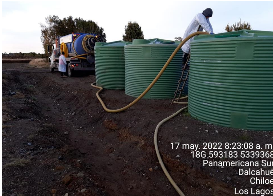
Fotografía N°9: Retiro de Lixiviados por Empresa Tresol zona adecuación. Tomada: Martes 17 de Mayo del 2022.