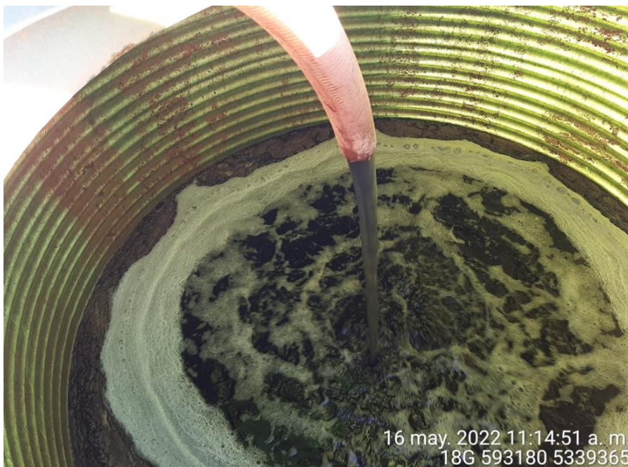
Fotografía N°4: Extracción de Lixiviados a estanque por personal municipal. Tomada: Lunes 16 de Mayo del 2022.