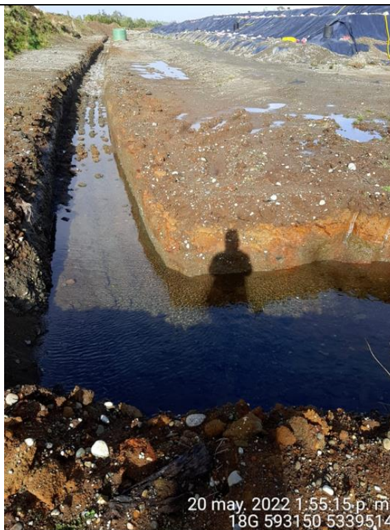
Fotografía N°30: Estado canales aguas lluvias