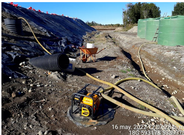
Fotografía N°1: Extracción de Lixiviados desde cámaras C02 por personal municipal. Tomada: Lunes 16 de Mayo del 2022.

Para dar cumplimiento a lo indicado en Res. Exenta N°604. A continuación, se presenta el registro fotográfico de las actividades de extracción de la semana del 16 al 22 de Mayo del 2022.