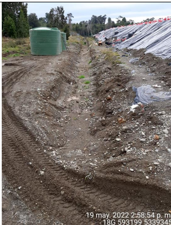
Fotografía N°29: Estado canales aguas lluvias