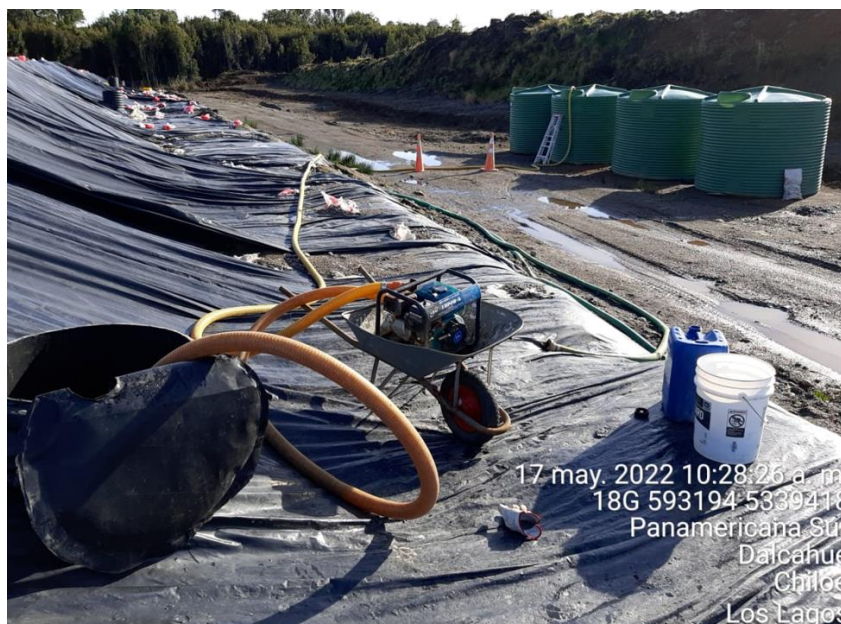
Fotografía N°5: Extracción de Lixiviados desde C12 por personal municipal. Tomada: Martes 17 de Mayo del 2022.

17 may. 2022 10:28:26 a. m. 18G 593194 5339418 Panamericana Sur Dalcánhue Chiloe Los Lagos