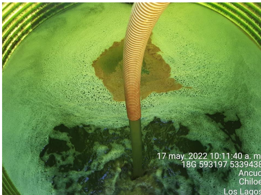
Fotografía N°8: Extracción de Lixiviados a estanque por personal municipal. Tomada: Martes 17 de Mayo del 2022.